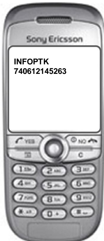
Gambar rajah 1